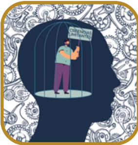
Ruptura de creencias limitantes