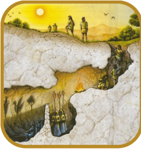
Bienvenida / Mito de la caverna de Platón