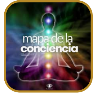
Mapa de la conciencia