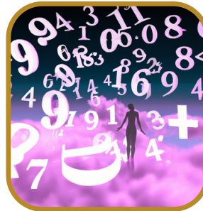
Misión de vida con numerología