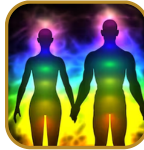
Energía, Vibración, Frecuencia y Resonancia