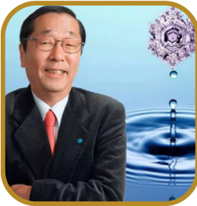
Gotas de agua Dr. Masaru Emoto