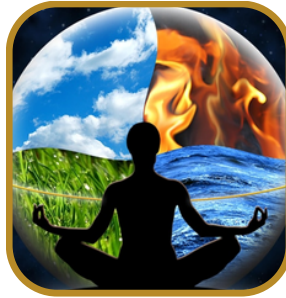
Los 5 cuerpos y sus elemento