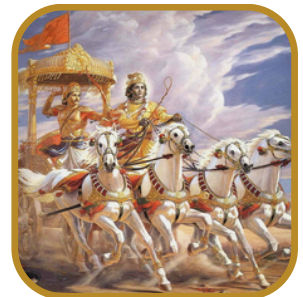
Kuravas y Pandavas