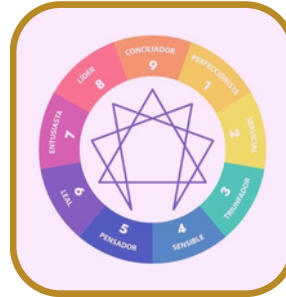
Tipo de personalidad